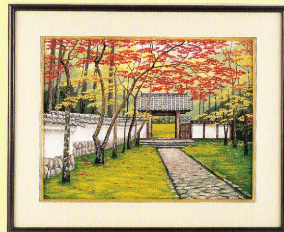
4号 No.477 苔寺の秋 ¥4,900 額縁 黒ぶち4号 ¥6,800