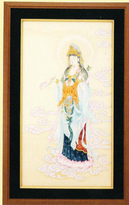
7号 No.903 雲上観音 ¥7,000 額縁 カスタム7号 ¥9,800